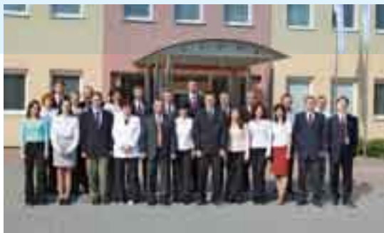
Firma má v súčasnej dobe 29 zamestnancov, 3 pôsobia v technickej kancelárii v Košiciach so sídlom na Jakobyho ul. 1 .