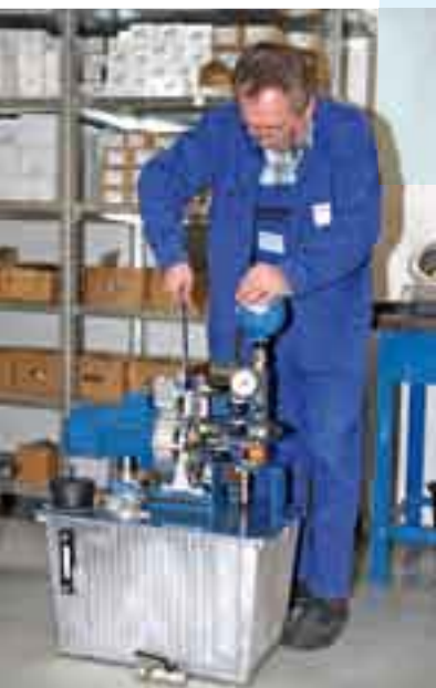
Montáž hydraulických agregátov